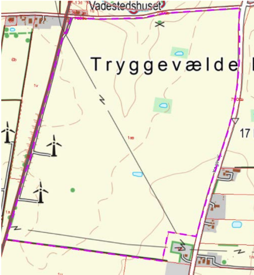
Matrikelkort med solcellearealet vist med lilla stiptet linje.

Idéfase for Solcellepark ved Tryggevælde Mark - indkaldelse af idéer fra den 15. januar til den 12. februar 2019