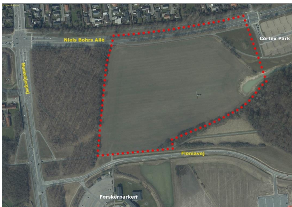
Luffoto af planområde

EKSPEDITIONSTID mandag-torsdag 10.00-15.00 fredag 10.00-12.00 lørdag-søndag lukket