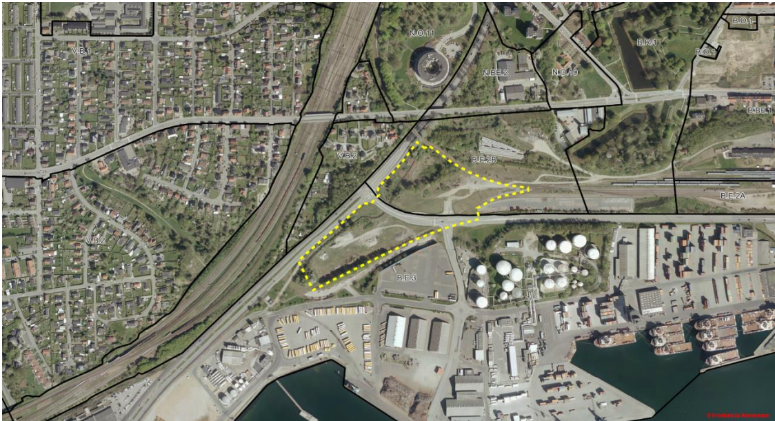
Eksisterende rammer. Området ved Holstensvej er vist med gul stiplede linje.

Ønsket om en fremtidig bebyggelse i op til 20 m er ikke i overensstemmelse med bebyggelseshøjden i rammen for det nordlige område, B.E.2B.