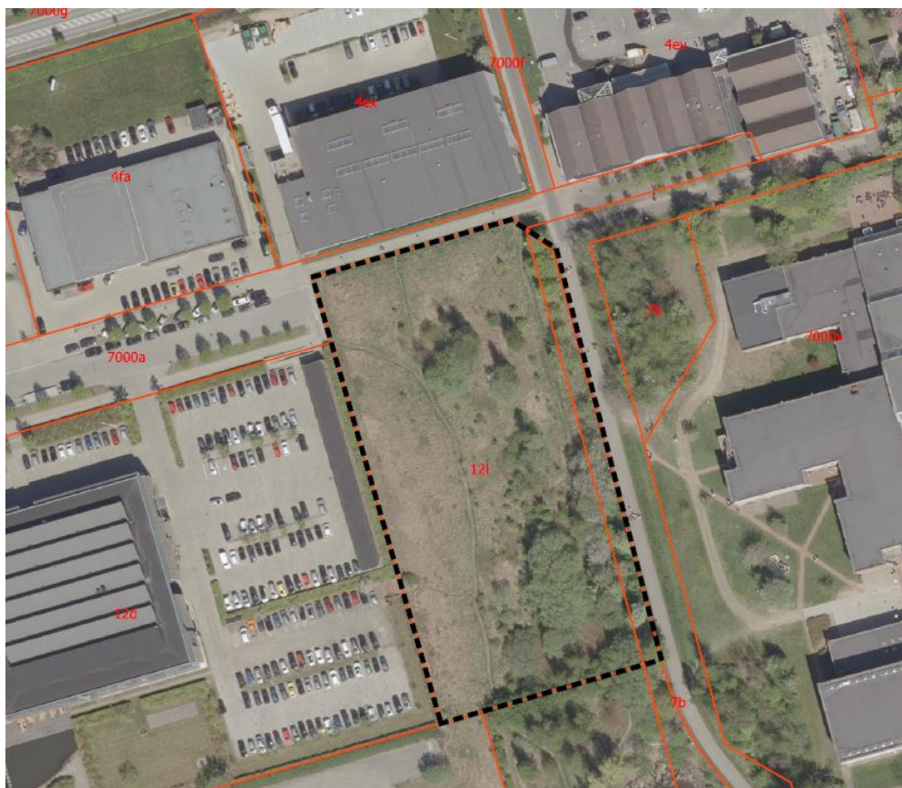
Området der foreslås omdannet til boligområde