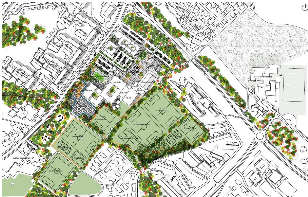
Illustration fra helhedsplanen af projektområdet

Projektets formål er at skabe rammerne for ny skole og hal. Visionen er at skabe et samlingspunkt for hele Gødvad-området med den nye skole og hal som de primære funktioner. I planen er angivet placeringen af ny skole og ny hal samt forslag til omdannelse af centerområdet, herunder også nuværende detailhandel.