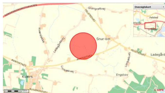
Placering af biogasanlæg ved Kværs.

Placeringen af det kommende biogasanlæg er sket ud fra en lang række hensyn. Der er bl.a. gode logistik og infrastrukturforhold, gode muligheder for tilslutning til det eksisterende naturgasnet samt et stort biogaspotentiale i biomasser fra nærområdet. Derudover har det også haft stor betydning, at anlægget bliver placeret i passende afstand til bebyggelse og særlige naturområder.