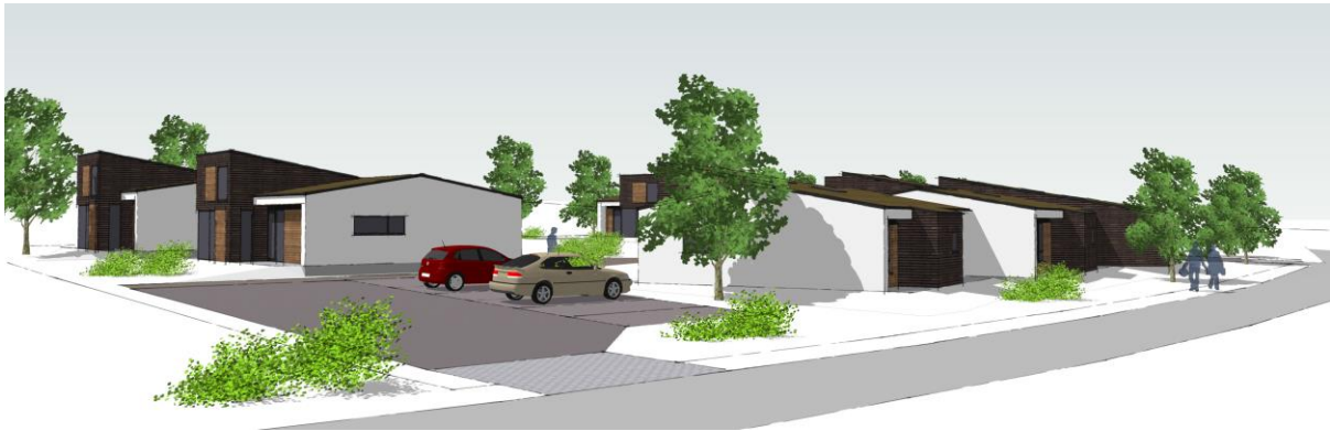
Foreløbig skitseforslag til bebyggelsen set fra Gammel Nybyvej

Rækkehusene ønskes opført som en fortolkning af et trelænget gård. "Gårdrummet", som de tre længer danner, ønskes anvendt til fælles friarealer. Ydermere ønskes der mulighed for, at dele af tagkonstruktionen henholdsvis fremstår med saddeltag med lav rejsning kombineret med ensidet taghældning. Tagbeklædningen ønskes evt. udført som grønne tage (levende/beplantede tage).