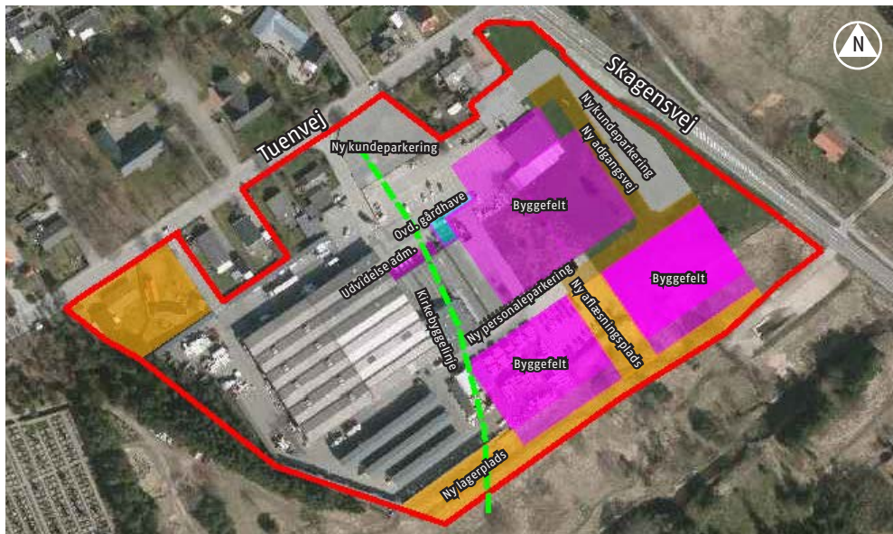
Skitsen viser et eksempel på, hvordan området kan disponeres, hvis en bebyggelsesprocent på 50 udnyttes fuldt ud.

Med udvidelsen af tømmerhandlen vurderes, at der ikke vil ske nogen væsentlig ændring af trafikmængden fra personbiler pga. ændrede købsmønstre. XL-Byg Elling Tømmerhandel A/S forventer, at trafikmængden af tung trafik reduceres, da større lagerkapacitet medfører, at tømmerhandlen kan modtage større mængder ad gangen, hvorfor der ikke er behov for varelevering så ofte.