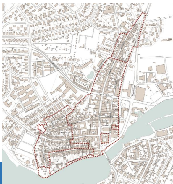
Otte eksisterende rammeområder: 3.B.18, 3.B.19, 3.B.25, 3.BE.01, 3.C.01, 3.C.01A, 3.C.03 og 3.F.16.

For at sikre en midtbykerne med handel, service og lignende ønsker Kerteminde Kommune at begrænse størrelsen på det udlagte centerområde, således at butikker og lignende ikke udtyndes over et større område. Al eksisterende anvendelse er dog fortsat lovlig. De tre øvrige rammer udlægges til beboelse.