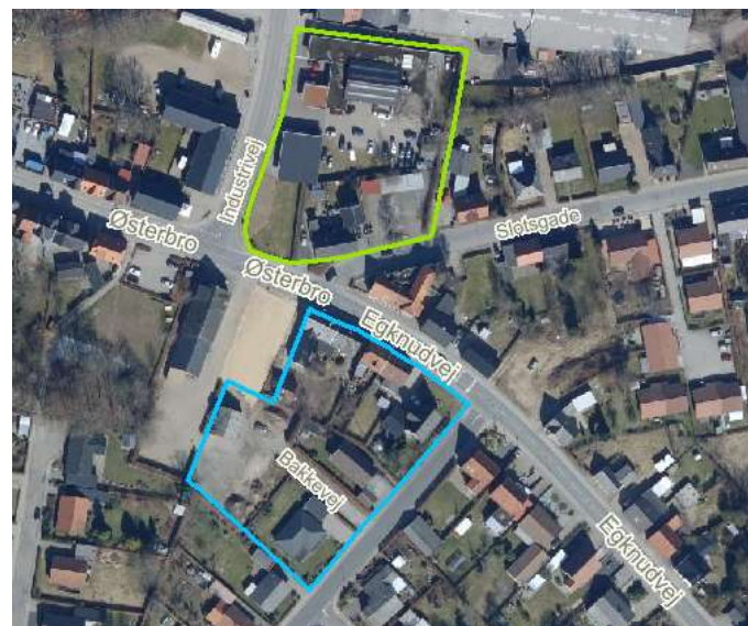
Figur 1 - Forslag til lokalplanafgrænsning for butik ses med grøn markering. Den blå markering viser afgrænsningen for en anden nyere lokalplan for en detailhandelsbutik i Ølgod, der ikke behandles i dette kommuneplantillæg.

Der søges om etablering af en dagligvarebutik på hjørnet af Industrivej, Østerbro og Slotsgade. Butikken vil være 1200 m 2 og skal hovedsageligt betjene lokalområdet med dagligvarer. Foran butikken skal der etableres et område til parkering for butikkens kunder med ca. 55-60 p-pladser. På parkeringsarealet gøres det muligt at etablere en ubemandet tankstation. Der foreslås udført et grønt bælte mellem parkeringspladserne og ud til Industrivej, Østerbro og Slotsgade, for at tilføje området et grønt præg. Adgangsveje til butikken er fra Industrivej og Slotsgade.