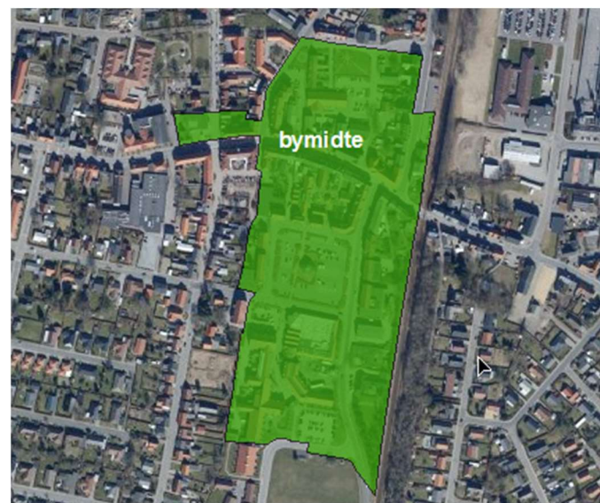
Figur 2 - eksisterende bymidteafgrænsning.

Den eksisterende bymidteafgrænsning i Ølgod kan ses af figur 2. Etablering af nye butikker og omdannelse af eksisterende bygninger til butikksformål skal ifølge planloven ske indenfor en afgrænset bymidte.