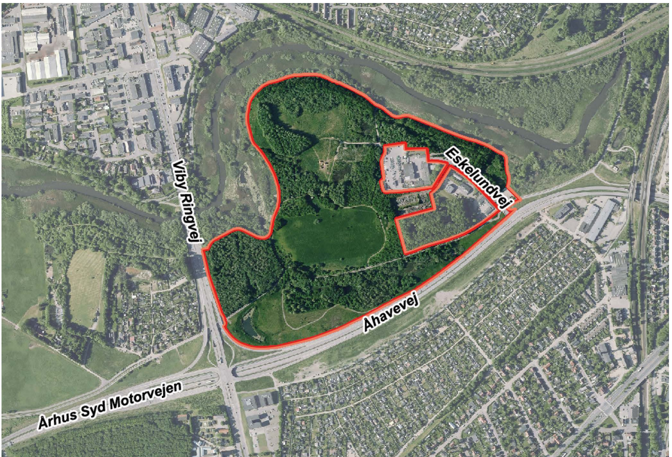
Området set fra luften.

Området der planlægges for har et samlet areal på 32ha og er afgrænset af Århus Å mod nord og øst og af de to større veje Ny Åhavevej og Ringvejen på de andre sider mod syd og vest.